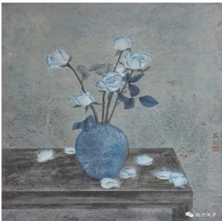
刘静《蓝玫瑰》 中国画138cmX68cm 滇西科技师范学院教师

此次我校女教师、女大学生入选的作品以独特的艺术形式展现了当代女性多元化的艺术创作及独特的艺术魅力，充分显示了学校师生的专业水平和风采。